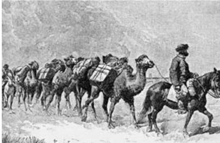
«Dann sehe ich die Karawane...» – Bonvalots Expedition in der Dsungarei

gung jedes Satzes – und sogar die Embryos meiner eigenen Klammersätze. Zu diesen Merkmalen gehört auch die Vorliebe meines Vaters für das Semikolon (oft vor einer Konjunktion – so wie man es zuweilen in der Sprache seiner Hochschullehrer antrifft: «that scholarly pause», ein Echo bedachtsamer englischer Logik – aber gleichzeitig mit Montaigne verwandt, den er so hoch schätzte); und ich bezweifle, dass die Entwicklung dieser Merkmale unter meiner oft eigensinnigen Feder ein bewusster Akt war.