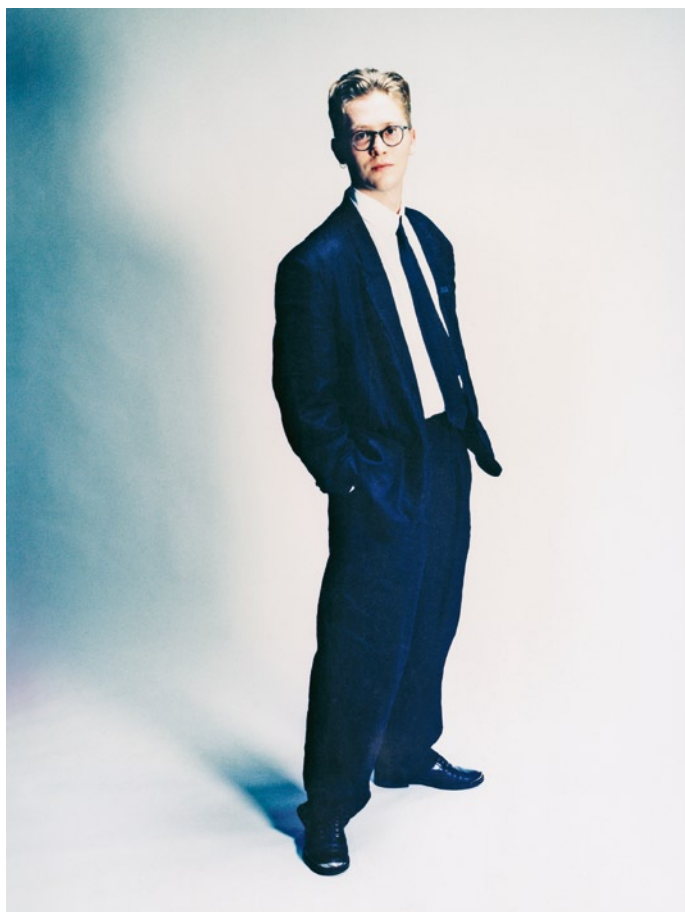
Honey Pie, you're not safe here, Düsseldorf 1991.