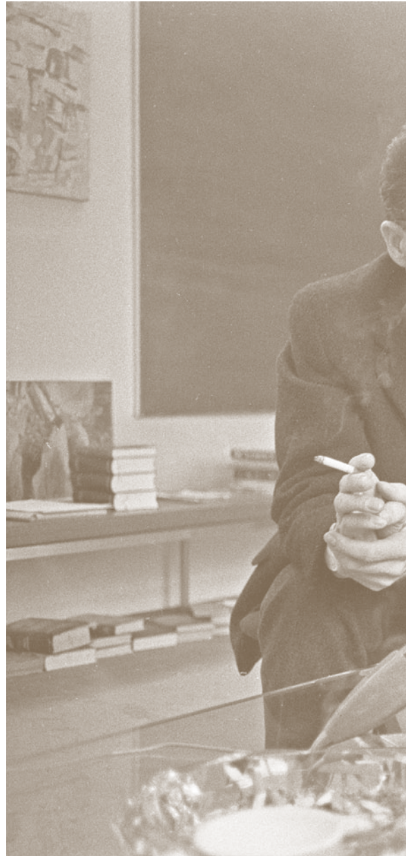
Mit Heinrich Maria Ledig-Rowohlt