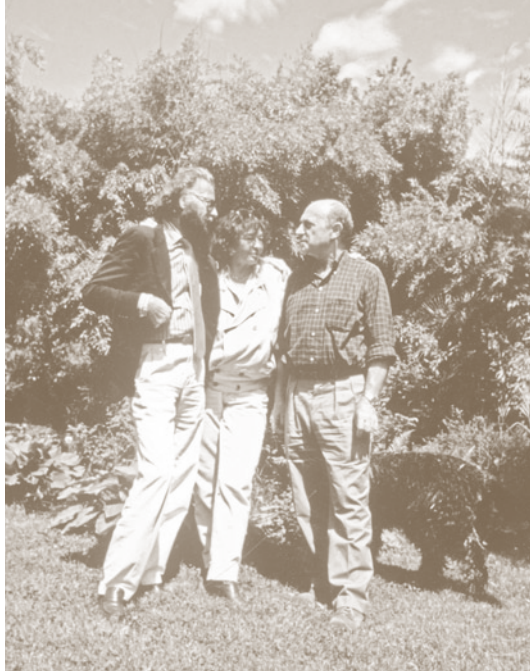
Mit Inge Feltrinelli und Amaldo Pomodoro Ende der achtziger Jahre