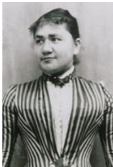
Die Mutter Pauline Einstein, geb. Koch