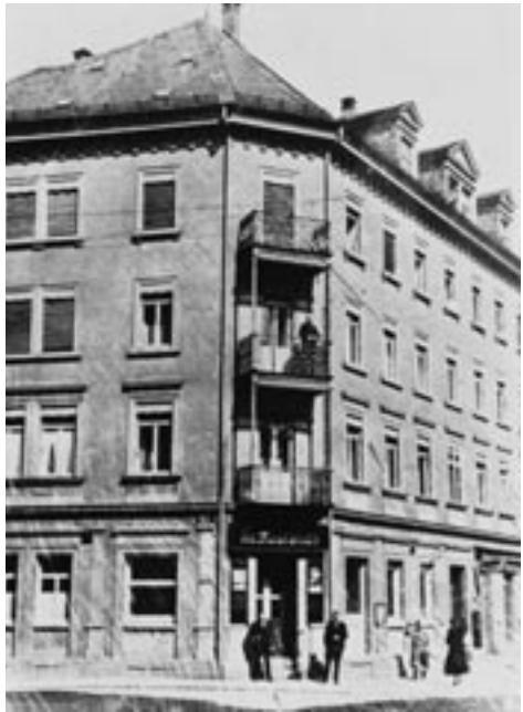
Das Geburtshaus in Ulm, Bahnhof- straße