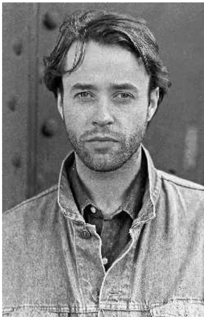
Porträt, fotografiert von Frida am U-Bahnhof Kottbusser Tor, 1989