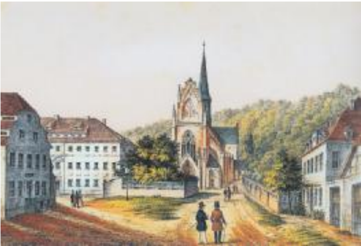
Schulpforta: Kirche und Schulhaus, um 1850

zu gewöhnen, Manuscripte, um mich zu wischen und ein Nachttopf. Mir gegenüber wohnt eine Nonne, die ich mitunter besuche um mich an ihrer Sittsamkeit zu erfreuen. Sie ist mir sehr genau bekannt, von Kopf bis zur Zehe, genauer als ich mir selber. Früher war sie Nonne, dünn und schwächling – ich war Arzt und machte daß sie bald dick wurde. Hier kann der Leser einen Blick in Nietzsches Dunkelkammer werfen – ohne antike Maske, ohne Täuschung, ohne Hemmung. Der depressive Stubenhocker, der dem Selbstmord nahe ist, vernascht kurzerhand im medizinisch-fiktiven Tarnmäntelchen eine Nonne. Solch eine Phantasie ist für einen wohlherzogenen Pfarrerssohn skandalös. Aber noch nicht genug. Der Bruder der frommen Dame wird missbraucht, bis zur finalen Erschöpfung: Mit ihr wohnt ihr Bruder zusammen in zeitlicher Ehe, der war mir zu fett und blühend, den habe ich mager gemacht – wie eine Leiche. Er wird in diesen Tagen sterben – was mir angenehm – denn ich werde ihn secieren. Die gleichgeschlechtliche Liebe wird von Nietzsche immer wieder thematisiert, nicht umsonst schwärmt er etwa von Platons «Symposion» in den höchsten Tönen. Allerdings mischt Friedrich Nietzsche in seinem Euphorion dem platonischen Liebesideal eine gehörige Portion