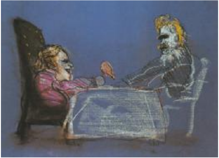
Alfred Hrdlicka: Nietzsche will kein Fleisch essen, 1985

sadistischer Phantasien bei. Das Fragment bietet noch weitere Einblicke in sein Innenleben. Euphorion wird von Schmerzen geplagt, er stöhnte, denn er litt an der Rückenmarksdarre . Das ausgetrocknete Mark ist, so will es das damals gängige Vorurteil, ein Zeichen für ausgiebig betriebene Onanie.