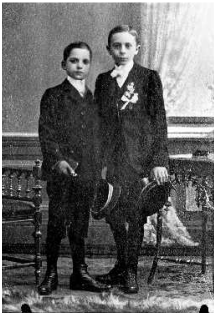
Goebbels (r.) am Tag seiner Kommunion, 3. April 1910

auch geistig aus der Gemeinschaft ausschließen zu wollen. Und dieser Gedanke gab ihm Fleiß und Energie 23 , bekannte er in seinem autobiographischen Roman Michael. Der Ehrgeiz, alles besser und genauer zu wissen als andere, begleitete ihn sein Leben lang.