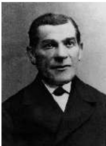
Der Vater: Friedrich Goebbels